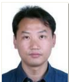
陈求稳 中国科学院