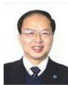
夏 军 中国科学院